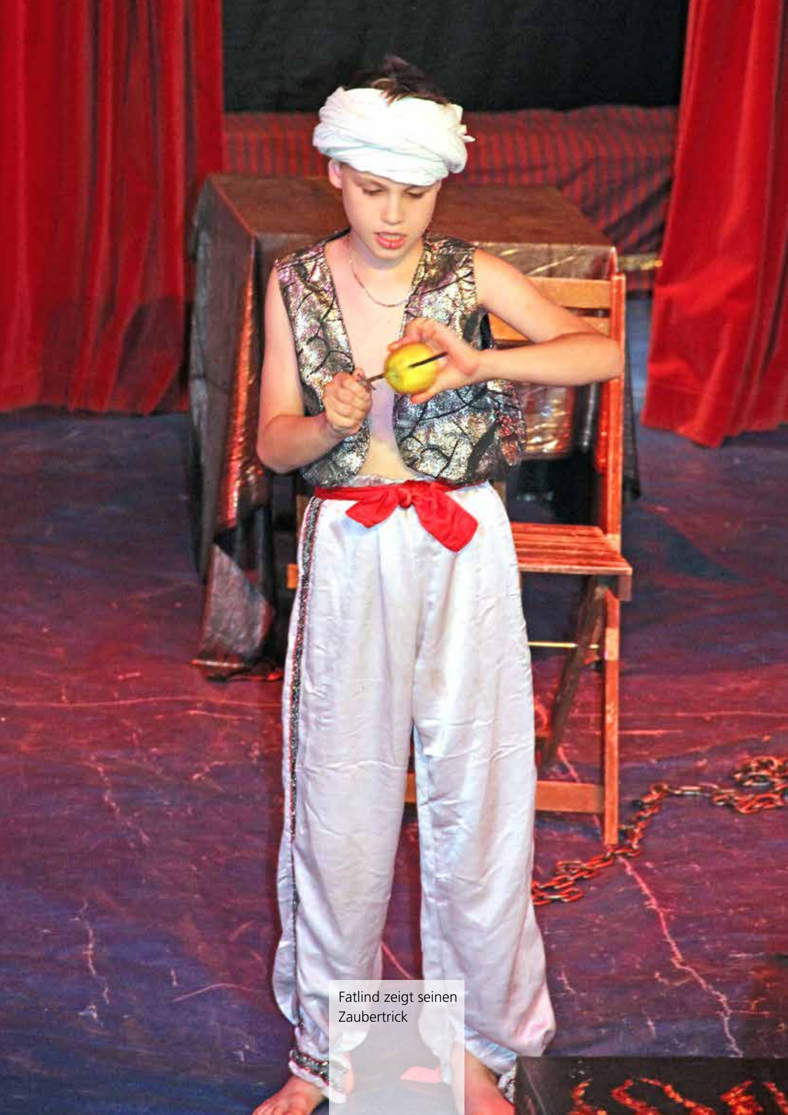
Fatind zeigt seinen Zaubertrick