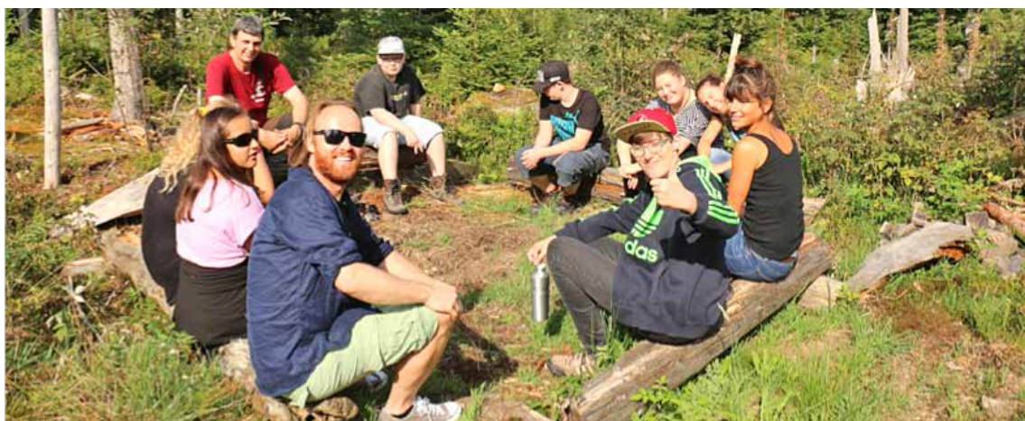
Gruppenfoto vom Erlebniswochen- ende