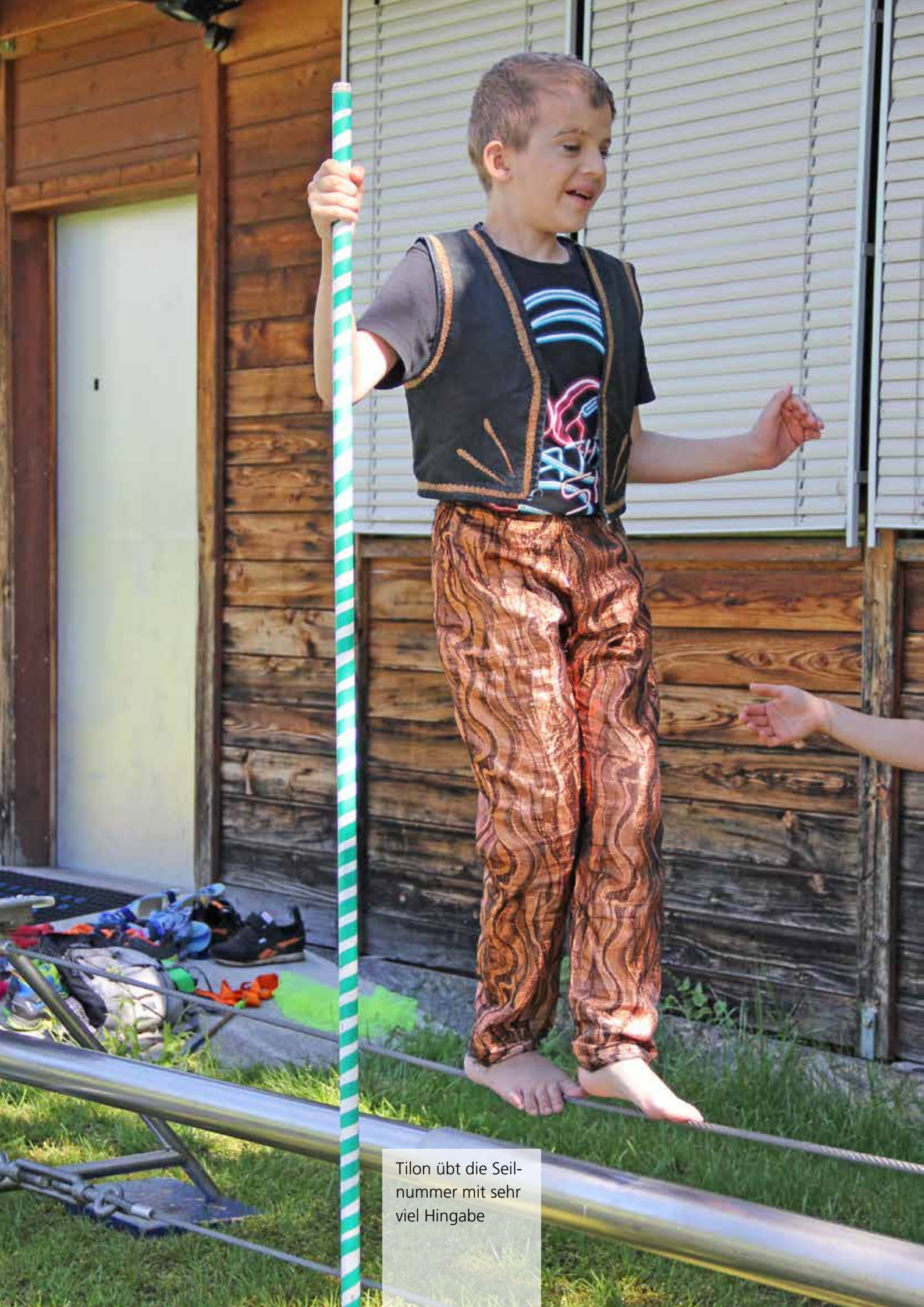
Tilon übt die Seilnummer mit sehr viel Hingabe