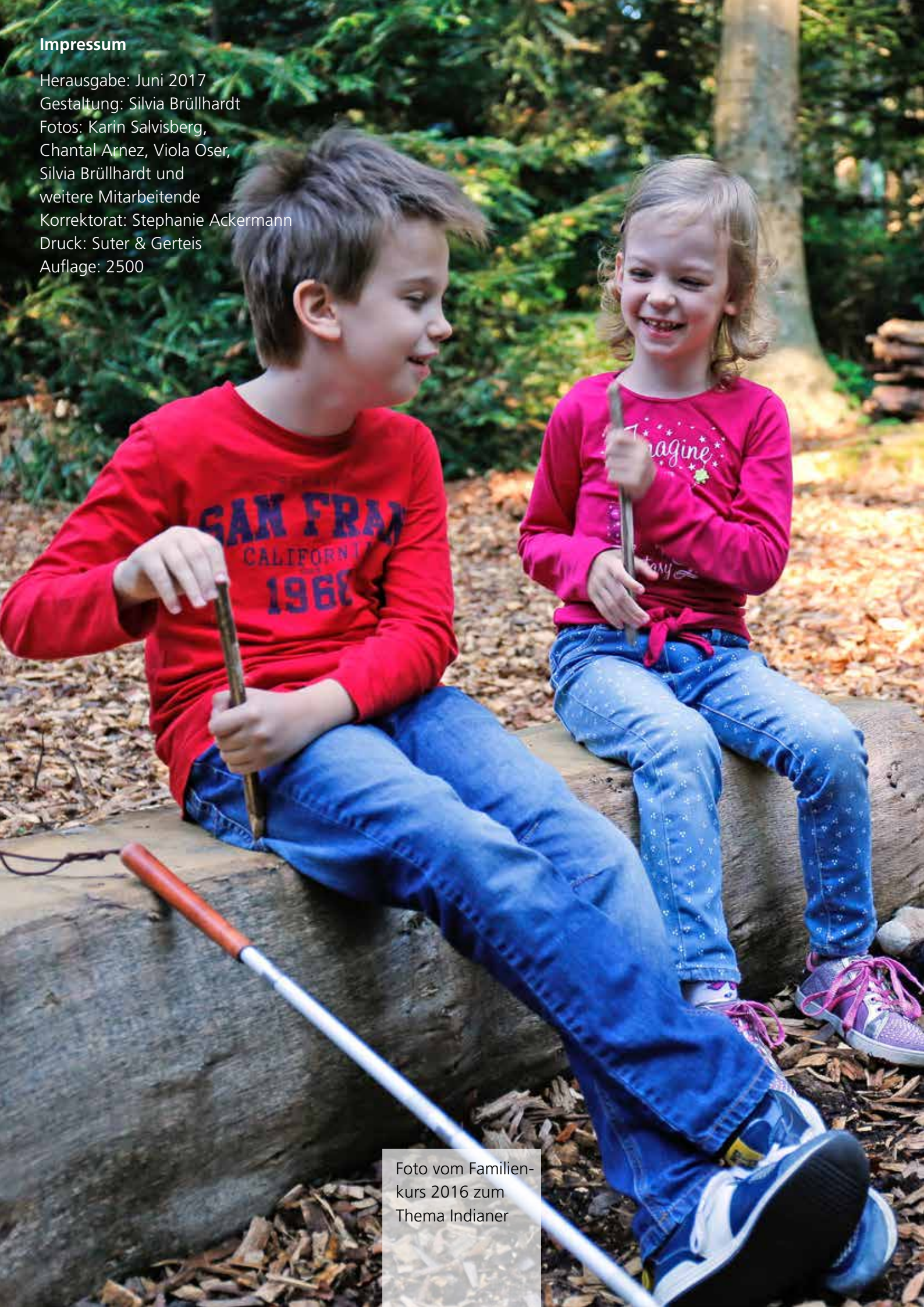
Foto vom Familien- kurs 2016 zum Thema Indianer