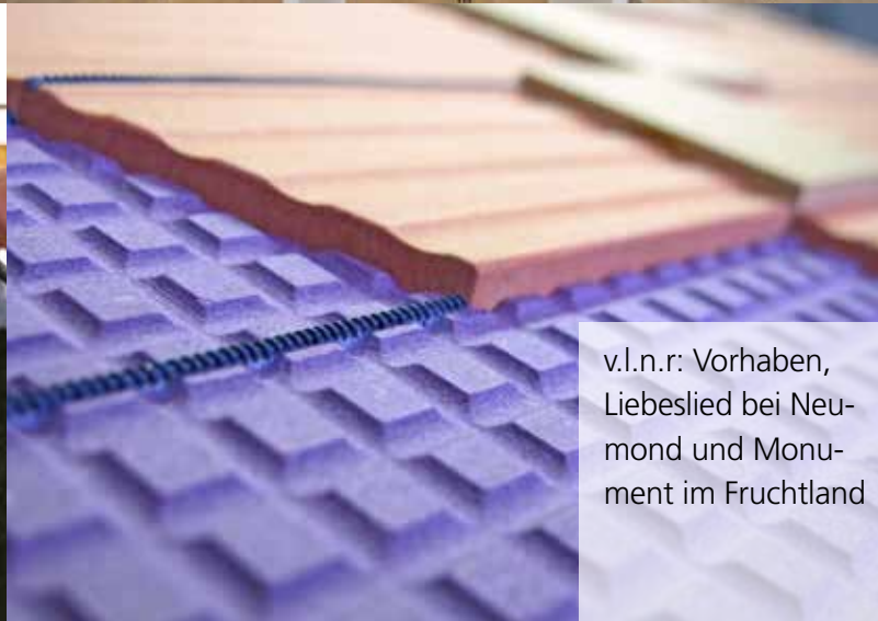
v.l.n.r: Vorhaben, Liebeslied bei Neumond und Monument im Fruchland